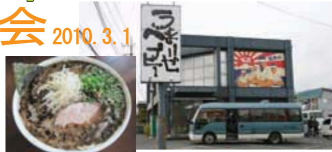
マイクロバスで到着

利用者みなさんは、当日の朝食前から「今日はラーメンの日」と期待に胸を膨らませ、お店では大満足の声と笑顔があふれました。