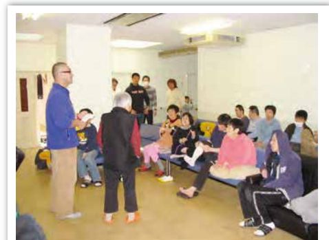
生活改善に向けての話し合い