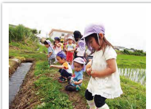
近くの農道へお散歩

今の大人は「みんな同じでなければならない」と育てられてきました。でも、ありのままを受け入れてもらえなくて困っている子がたくさんいます。子どもは手間暇がかかるものです。「子どもは一人ひとり皆ちがう」そのことを面白いと感じ、答えを急がない専門家の存在が重要です。お母さんも一人で子育てするのでなく、まわりが支え一緒に子育てをします。むかし「笑い貧乏」という言葉があったそうです。子どもをそばにおいて仕事をしていた時代、子どもの面白い行動を見て笑ってばかりで仕事はかどらず貧乏だったという話です。貧しくてもきっと幸せな家庭だったことでしょう。外まで響くように笑いが溢れ、子どもと関わるのが面白いと思える保育をしていきたいと思えます。