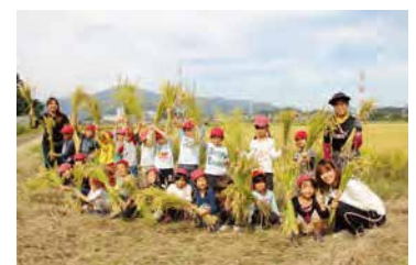
園児達の「田植え」「稲刈り」体験写真です。

京都の三大祭りといえば、祇園祭、葵祭、時代祭ですが、一番由緒のある祇園祭は、今まで猛暑の京都を敬遠して行く機会がありませんでした。しかし、去年は運よく「宵山」と翌日の「山鉦巡行」を見学することができました。「1200年の歴史がある素晴らしい祭り」の一言です。