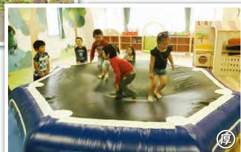
→ リトミックルームでは、 トランポリンで全身を 動かします。