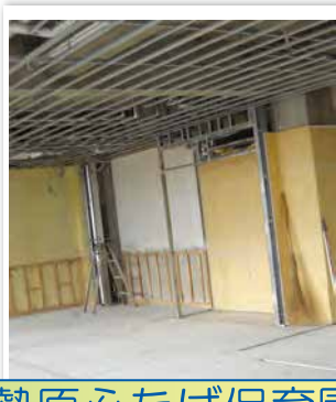
伊勢原ふたば保育園

開設から 15 年を経過しましたので各所に傷みが出ています。昨年申請を行い補助を受けることが決定しましたので改修工事を始めました。完成は 2 月末の予定です。ご協力をお願い致します。