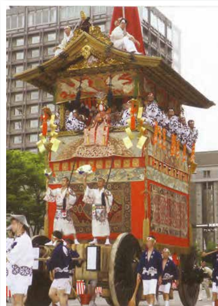
月鉦「山鉦」33基の一つ

そうだ600年ほど前は、ここ本能寺で信長も見ていたかもしれません。当時は高いビルもなく25メートルもある山鉦は抜きんでた代物だったことでしょう。疫病の祟りを祓うための山鉦はその日の内に解体をされ、また翌年に備えて各町内の倉に納まります。