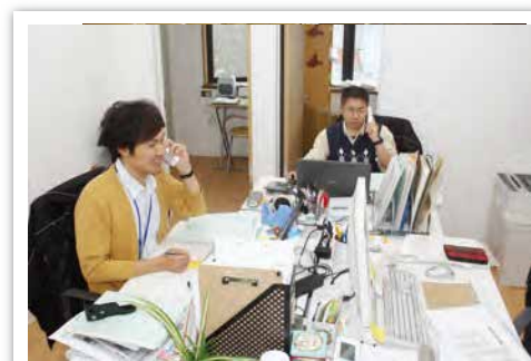
新しい相談事務室