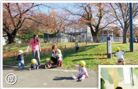
← 厚木市「ぼうさいの丘公園」 自然に囲まれた広い場所でのびのびと遊びます。