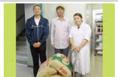
精米をして直ぐにお届けいただいています。(写真はみどり園)