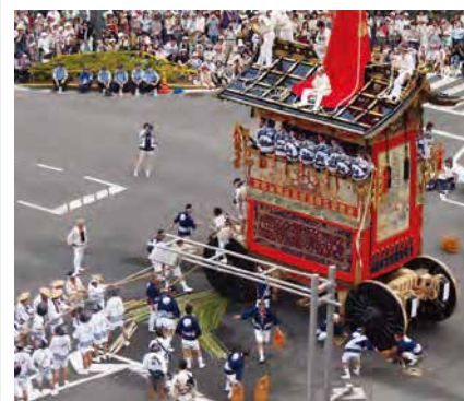
御池通の辻回し(京都市役所前)