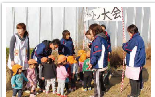
毎年行うマラソン大会での一齣です。

ブドウを育てる農夫のまなざしは、子育てにかかわる人や若い職員を育てるベテランの姿勢にも通じるものがあります。見守る側には知識、経験、愛情そして我慢も必要です。時に厳しく、時にはやさしく教え導きながら、日常はそっと見守る姿勢が本人の成長する力をひきだすことに繋がっていく場合も多いのではないかと思います。