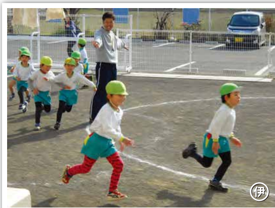
← 毎週水曜日に体操の先生より各年齢の発達に応じた指導を受けています。準備体操から始まり、この時期はマラソンを行い体力や運動能力を高めています。